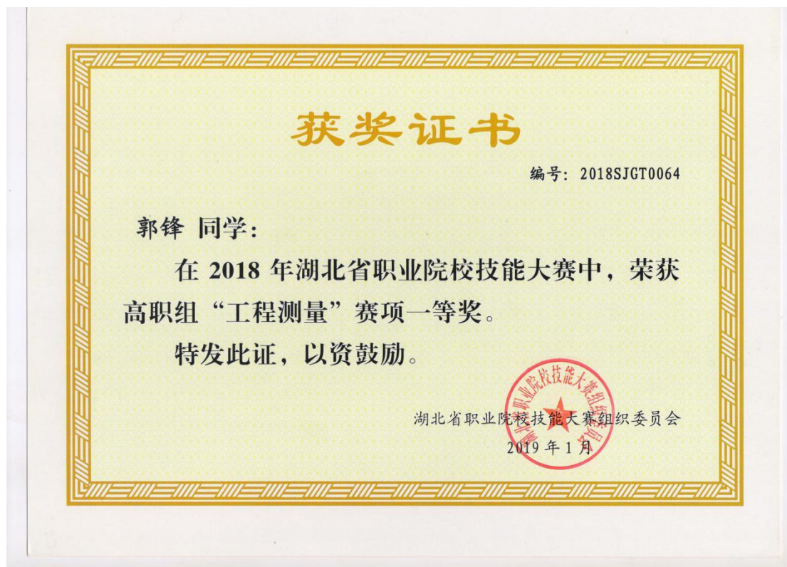
2018 湖北省职业院校技能大赛工程测量赛项一等奖