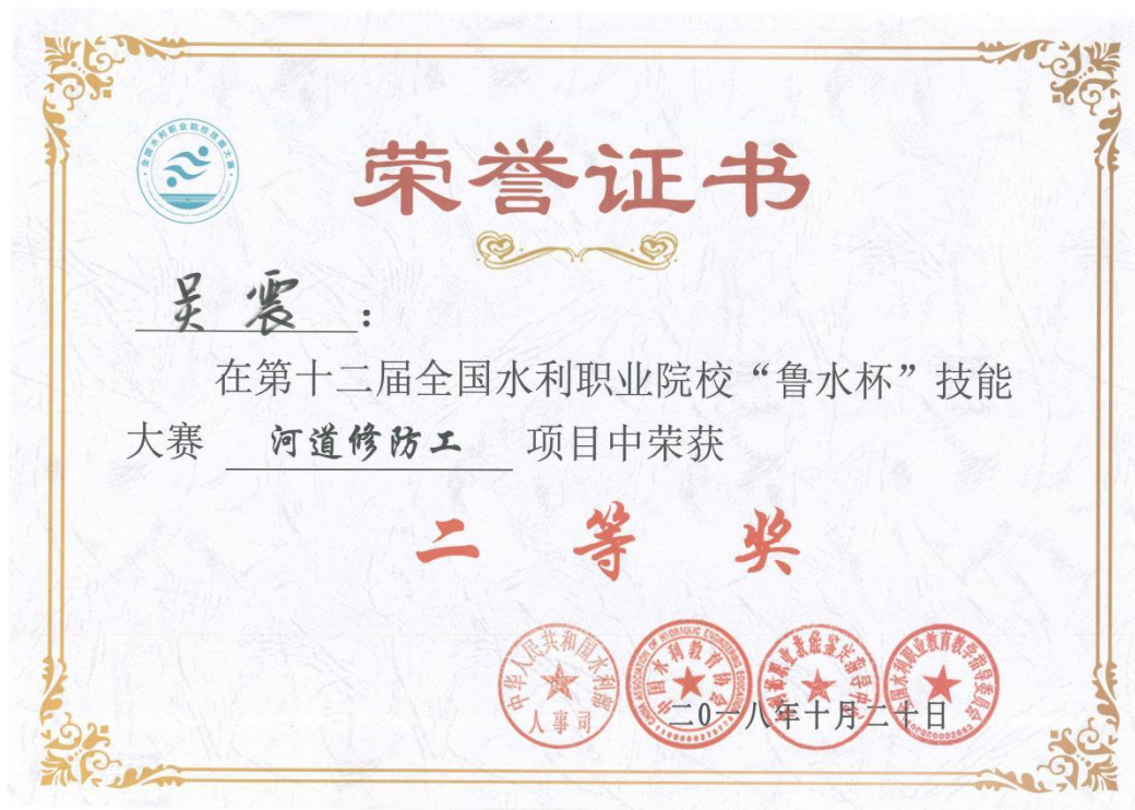
第十二届全国水利职业院校“鲁水杯”技能大赛河道修防工项目二等奖