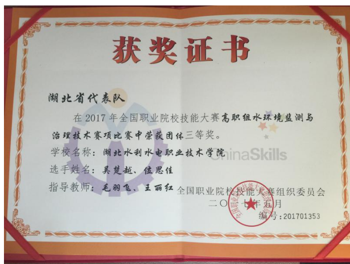
2017 全国职业院校技能大赛水环境监测与治理技术赛项三等奖