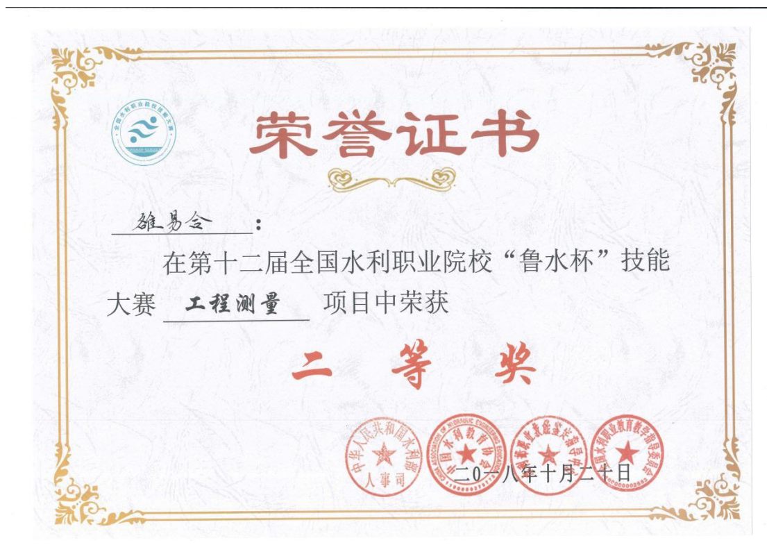
第十二届全国水利职业院校“鲁水杯”技能大赛工程测量项目二等奖