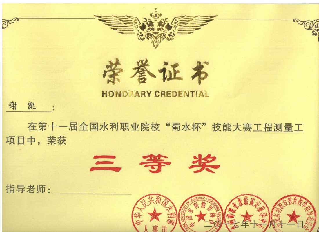
第十一届全国水利职业院校“蜀水杯”技能大赛工程测量工项目三等奖