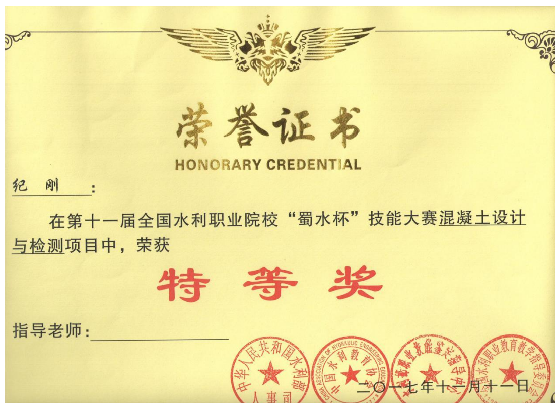
第十一届全国水利职业院校“蜀水杯”技能大赛混凝土设计与检测项目特等奖