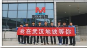
在武汉地铁工作的我院优秀毕业生