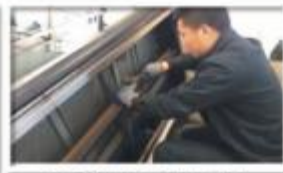
宏光F2扶手带导向轮更换