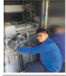
3号线三角湖站垂直电梯轿门门轴维修