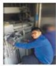
3号线三阳路站垂直电梯厅轿门门轴维修